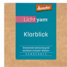
Lichtyam® Klarblick (Teemischung), 25g 16001