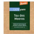
Lichtyam® Tau des Meeres (Teemischung), 40g 17224