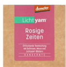
Lichtyam® Rosige Zeiten (Teemischung), 15g 17214