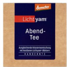
Lichtyam® Abendtee, 25g 16002

Inverkehrbringer ..... Andreashof, Kirchgasse 35, D-88662 Überlingen