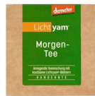
Lichtyam® Morgentee, 25g 16000