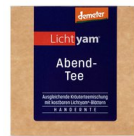
Lichtyam® Abendtee, 25g 16002