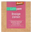
Lichtyam® Rosige Zeiten (Teemischung), 15g 17214

Inverkehrbringer ..... Andreahof , Kirchgasse 35, D-88662 Überlingen