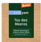
Lichtyam® Tau des Meeres (Teemischung), 40g 17224