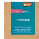
Lichtyam® Klarblick (Teemischung), 25g 16001