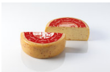
ÖMA Bauernkäse Chili, Bioland - Laib, ca.4,000kg 55179

Konsistenz ..... cremig, geschmeidig, schnittfest