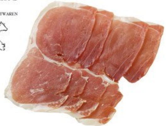
Ital. Mattonella Schinken