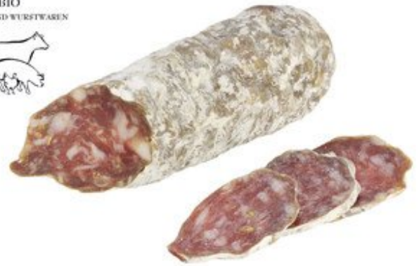
Salami con Finocchio